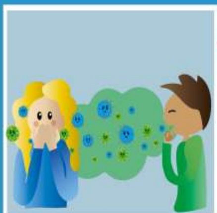
КАШЕЛЬ, ЧИХАНИЕ (ВОЗДУШНО-КАПЕЛЬНЫМ ПУТЕМ)