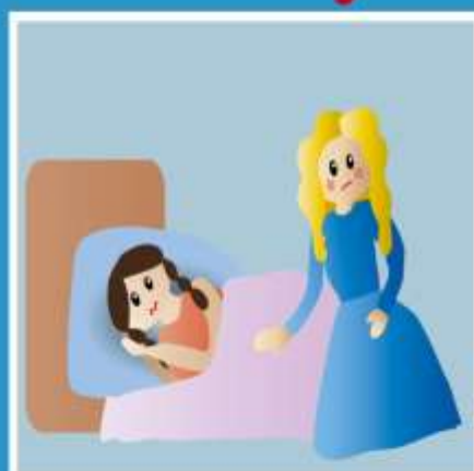
УХОД ЗА БОЛЬНЫМИ